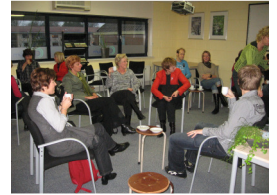
Onder het genot van een kopje koffie werd al even kennisgemaakt.